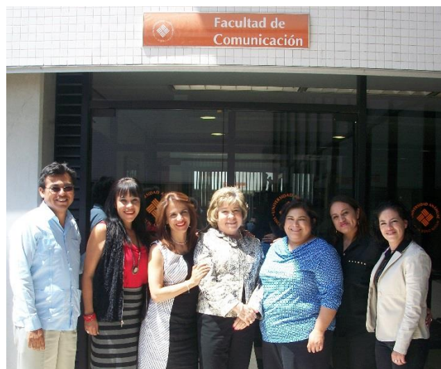
Los miembros del Comité Técnico del CONAC, reunidos en las instalaciones de la Facultad de Comunicación de la Universidad Anáhuac México Norte.

Asimismo se discutieron otros temas como la situación que guardan aquellas instituciones por acreditar en 2014; se abordó el estado actual que guarda el padrón de pares evaluadores, así como la propuesta de agenda para seguir desarrollando talleres de formación de evaluadores durante el siguiente semestre del presente año.